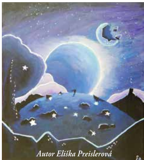
Autor Eliška Preislerová